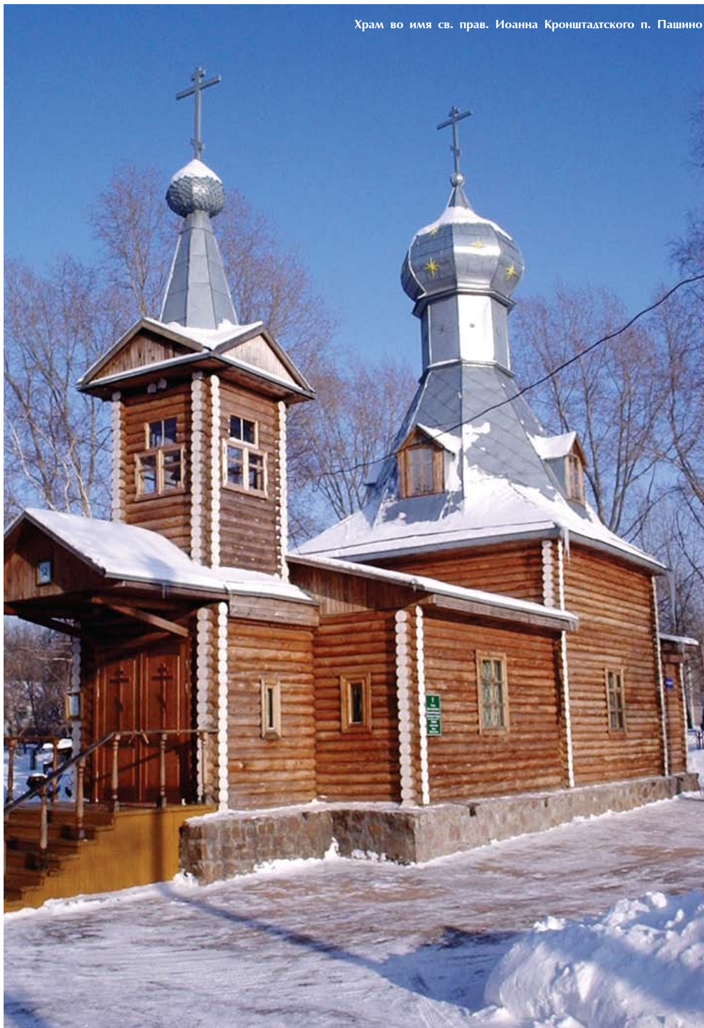
Храм во имя св. прав. Иоанна Кронштадтского п. Пашино