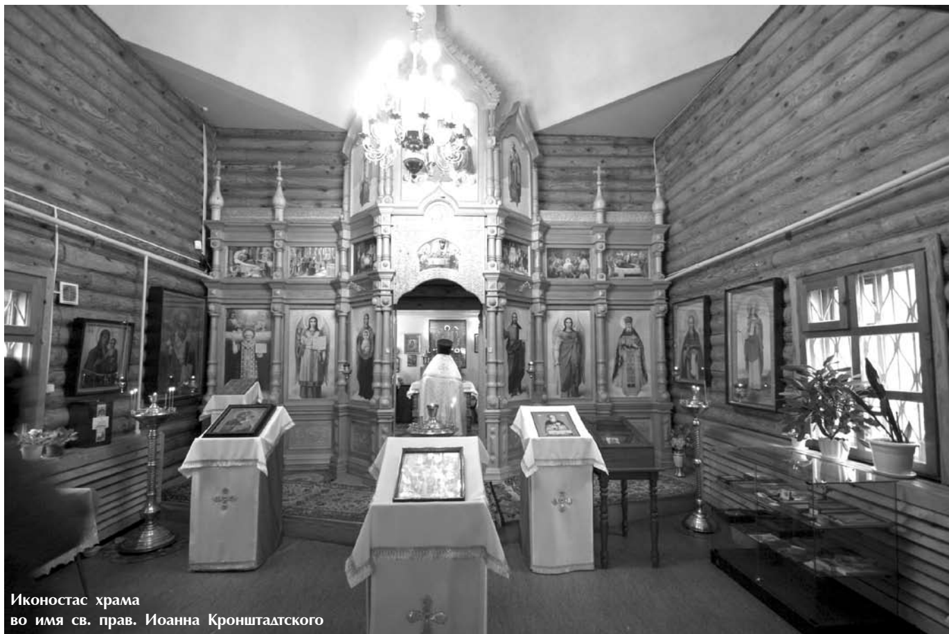
Иконостас храма во имя св. прав. Иоанна Кронштадтского