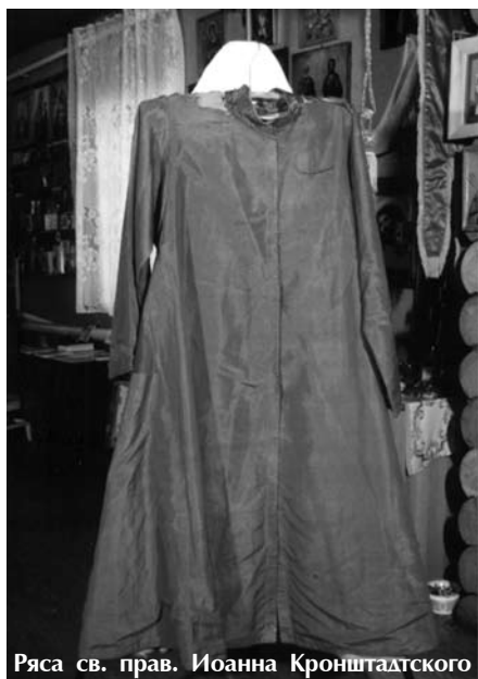
Ряса св. прав. Иоанна Кронштадтского