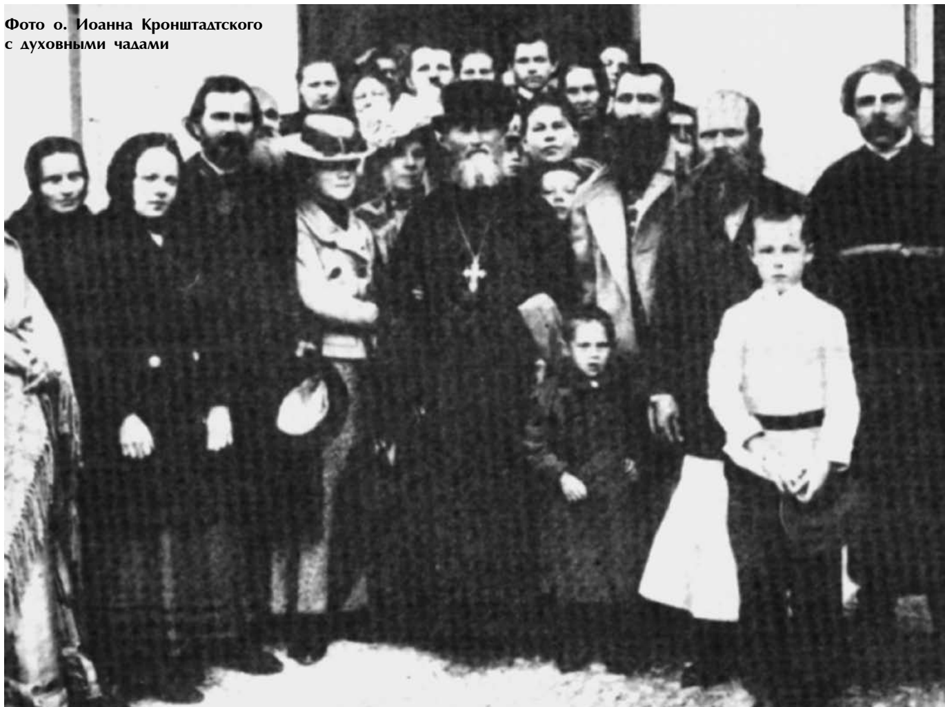
Фото о. Иоанна Кронштадтского с духовными чадами

в наши дни дела милосердия и любви — всем ведомые плоды этой живущей в Вас благодати и яркое проявление Вашего служения идеалу святости».