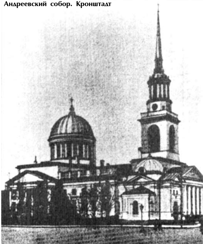
Андреевский собор. Кронштадт

и приютом. Он основал в своем родном селе женский монастырь и воздвиг там большой каменный храм, в Петербурге построил женский монастырь на Карповке, в котором и был погребен по своей кончине.