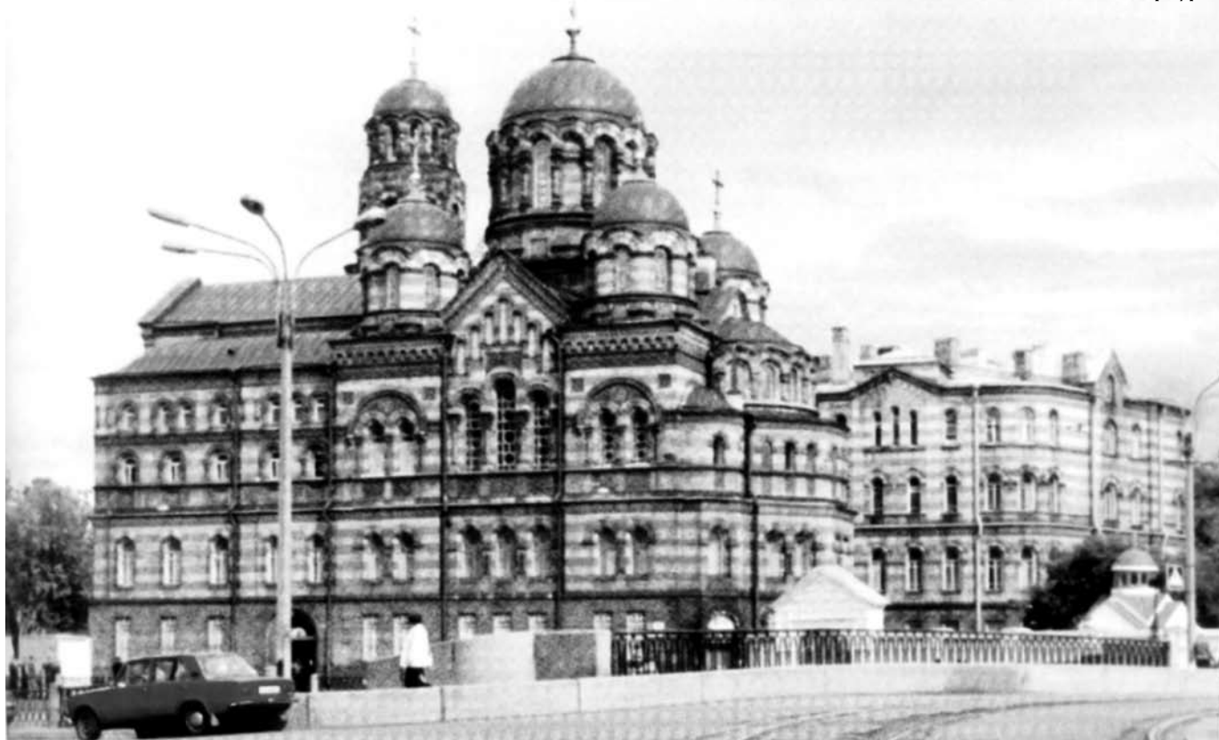
Иоанновский женский монастырь на Карповке (Санкт-Петербург)

Такой необычный пастырский подвиг молодого пастыря стал вызывать нарекания и даже нападки на него со всех сторон. Многие долго не признавали искренности его настроения, глумились над ним, клеветали устно и печатно, называли его юродивым. Руководство епархии вызывало его для объяснений и одно время даже запретило выдавать священнику Иоанну Сергиеву на руки жалование, так как он, получив его, все до последней копейки раздавал нищим. Но все эти испытания он переносил мужественно, ни в чем не изменяя в угоду нападавшим на него принятого образа жизни. И, с Божией помощью, он победил. За все то, над чем в первые годы его священнослужения смеялись, клеветали, что поносили и преследовали, впоследствии стали прославлять его, поняв, что он — истинный последователь Христов,