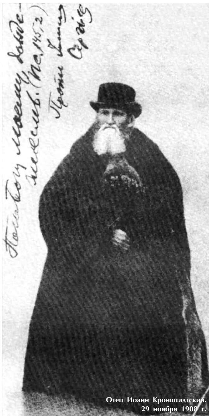
Отец Иоанн Кронштадтский. 29 ноября 1908 г.

подлинный пастырь, полагающий душу свою за овцы своя.